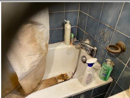
Photo n° PhAss005 Localisation : Eau Usée : SDB 1er étage Description : Baignoire : Rejet dans les eaux usées