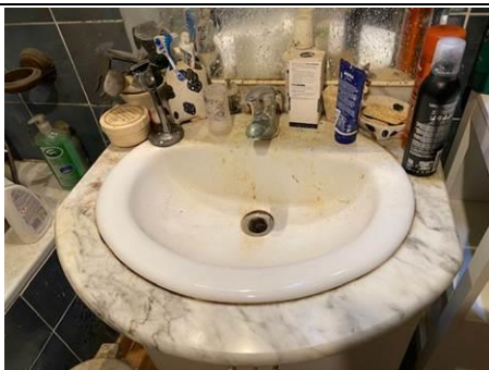
Photo n° PhAss004 Localisation : Eau Usée : SDB 1er étage Description : Lavabo : Rejet dans les eaux usées

Photo n° PhAss003 Localisation : Eau Usée : Cuisine Description : Evier : Rejet dans les eaux usées