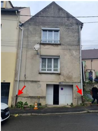
Photo n° PhAss001 Localisation : Eau Pluviales : Façade avant sur rue Description : Gouttière avant/rue : Rejet dans caniveau