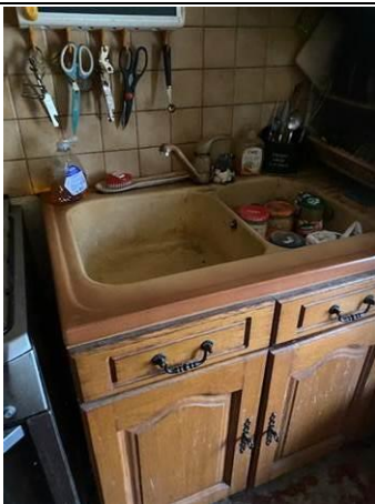
Photo n° PhAss003 Localisation : Eau Usée : Cuisine Description : Evier : Rejet dans les eaux usées

Photo n° PhAss002 Localisation : Eau Usée : WC RDC Description : WC : Rejet dans les eaux usées