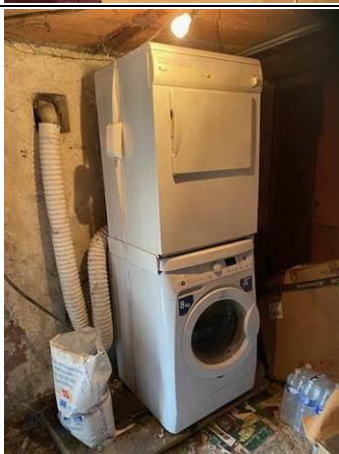
Photo n° PhAss007 Localisation : Eau Usée : Garage Description : Lave-Linge : Rejet dans les eaux usées