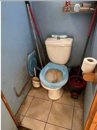
Photo n° PhAss002 Localisation : Eau Usée : WC RDC Description : WC : Rejet dans les eaux usées

Photo n° PhAss001 Localisation : Eau Pluviales : Façade avant sur rue Description : Gouttière avant/rue : Rejet dans caniveau