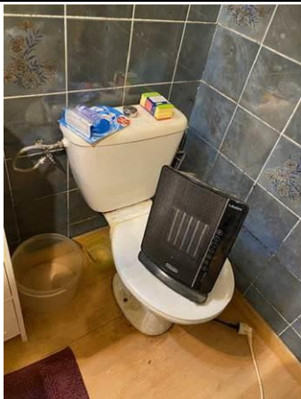
Photo n° PhAss006 Localisation : Eau Usée : SDB 1er étage Description : WC : Rejet dans les eaux usées