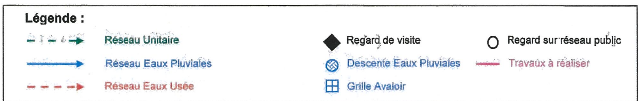
Schéma des installations donné à titre indicatif :